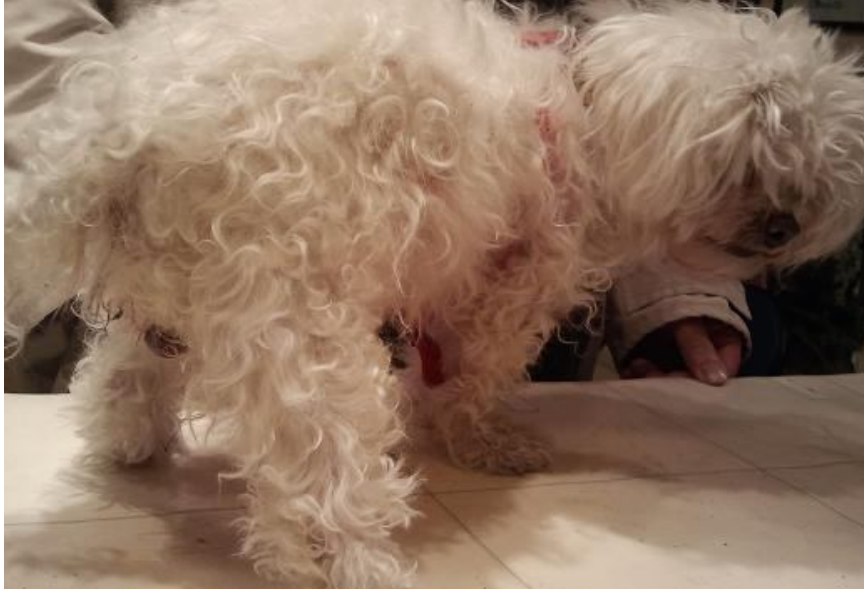
Púposított hát, erőlködés

Szuzit a gazdája azzal a panasszal hozta a rendelőbe, hogy a szuka tüzel és a péranyílásból „valami daganat emelkedik ki”. A kutyus az alábbi fájdalmas pozícióban állt.