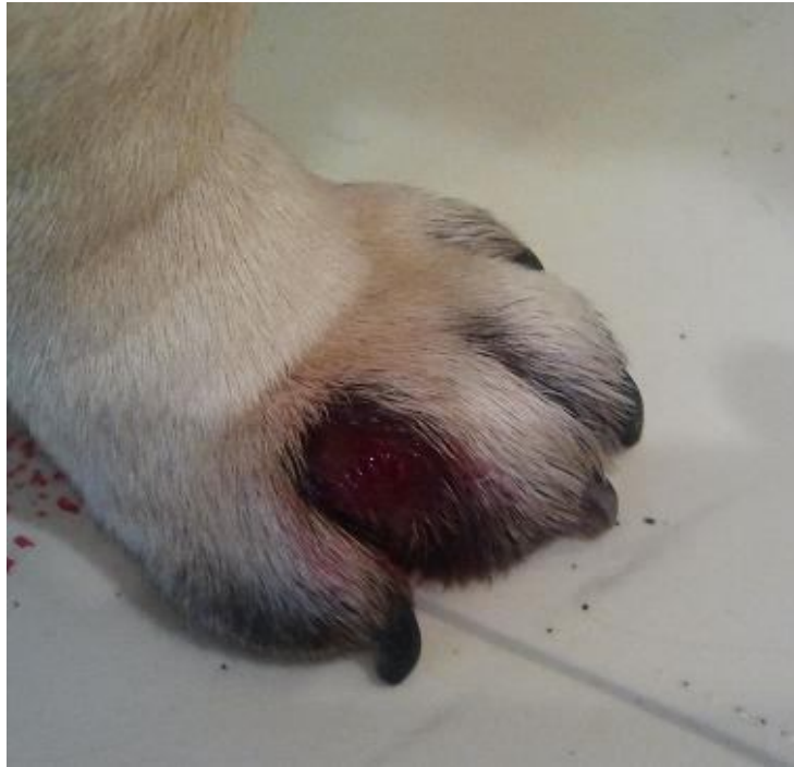
Toklász okozta seb

Bogyót a gazdája, egy fiatal hölgy, azzal a panasszal hozta a rendelőbe, hogy a kutya jobb első lábán az ujjak között egy duzzanat, majd seb keletkezett, amelyet gyakran intenzíven nyalogat. A sebből savós-gennyes váladék szivárog, a seb gyógyulásra nem hajlamos.